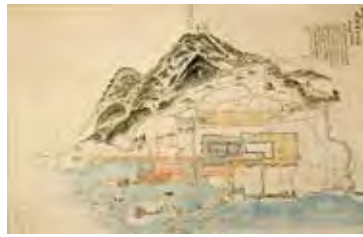
《島原城下の図 寛政以前》当館蔵